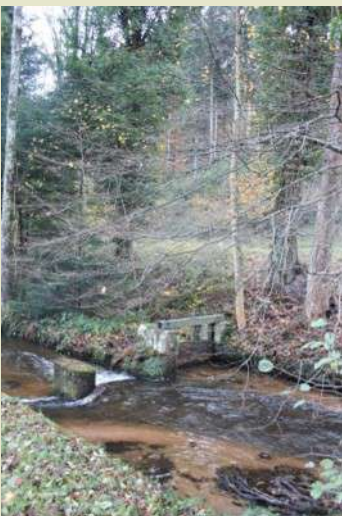
Dérivation pour le Rosenmeer à la Fischhutte