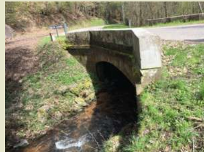
Pont entre Neuhiesel et Grendelbruch (Gothey Brucke)