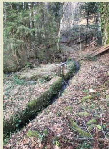
Dérivation du Lauterbach vers le Rosenmeer

Le Rosenmeer, qui détourne 1/3 de l'eau depuis la Fischhutte vers Rosheim (Accord de 1474), se jette dans l'Ehn. Une autre dérivation, souterraine au pont de la gare, renforce l'Entenbach qui alimente les étangs de pêche de Gresswiller (situés côté Dinsheim).