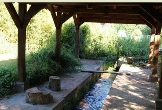
◀ Le lavoir avec l'écluse