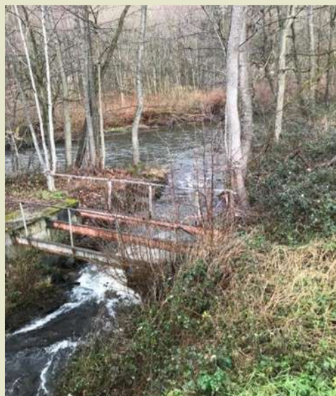
◀ Passerelle près du confluent de la Magel avec la Bruche

Les photos ne suffisent pas à exprimer l'émoi de retrouver ces endroits fonctionnels aménagés et si longtemps entretenus avec soin par nos anciens.