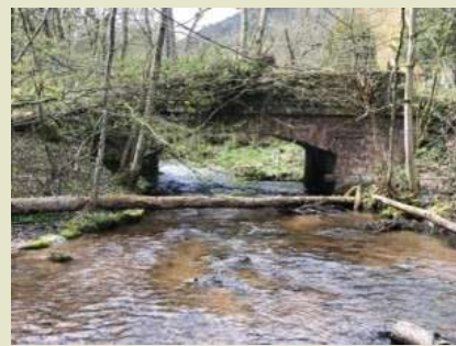
Pont abandonné près du Neuhiesel