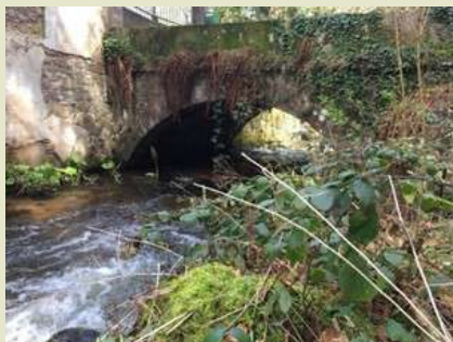
Sur la D266