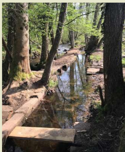
Le lavoir du Gassenacker