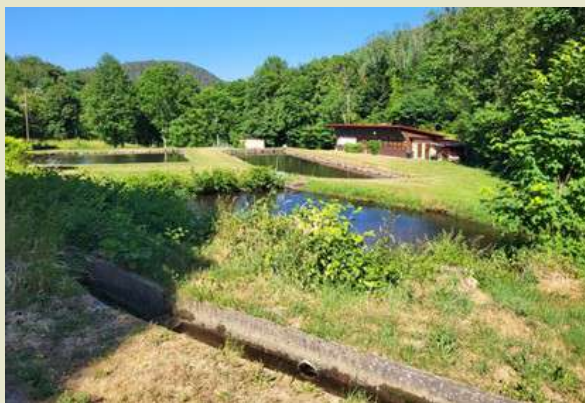
▶ Les étangs de pêche de Grendelbruch. En avant-plan, le canal d'alimentation de ces derniers.