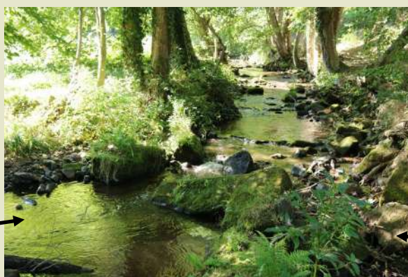
Vanne et dérivation pour l'alimentation du moulin de Mollkirch et du lavoir