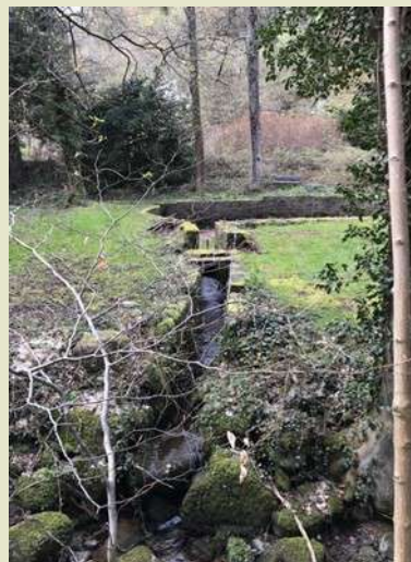
Cette dérivation se trouve à hauteur de Grendelbruch sur la route allant vers la Rothlach