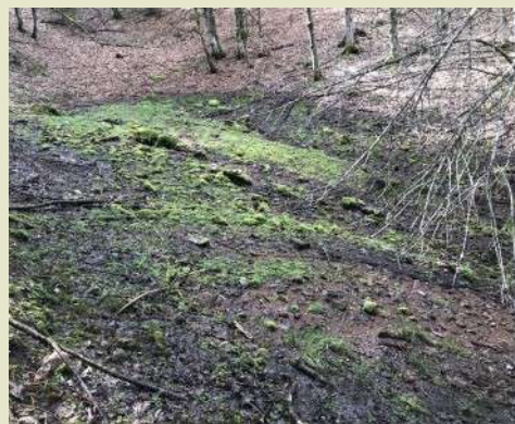
Source de la Magel