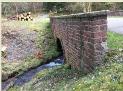
Pont en allant vers la source