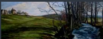
Les Tables d'Histoire de la Magel