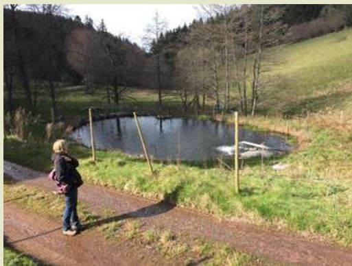
◀ Etang Magelhof